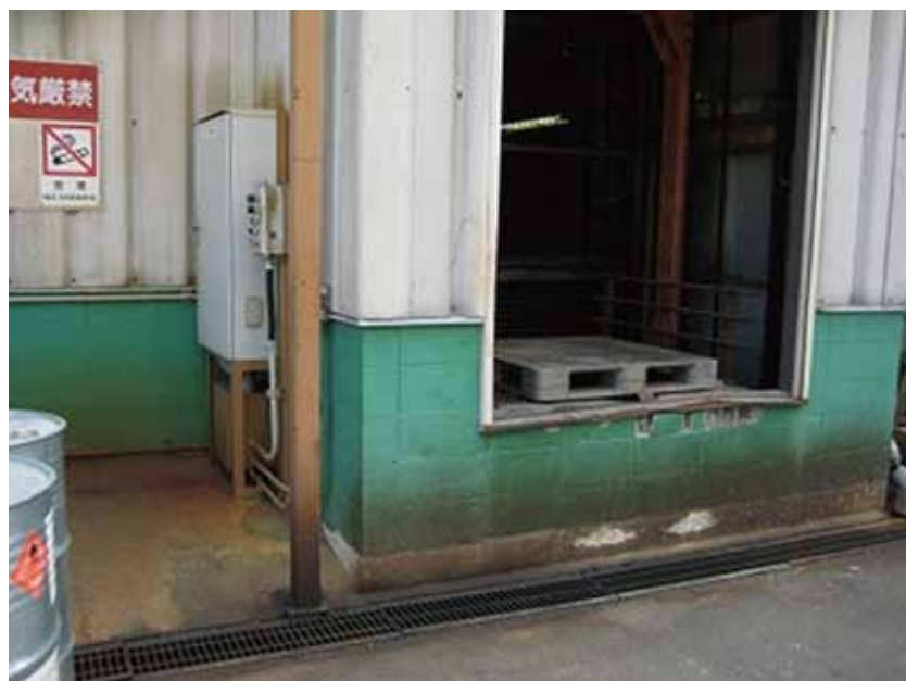
1階ホールディングゲート追加前