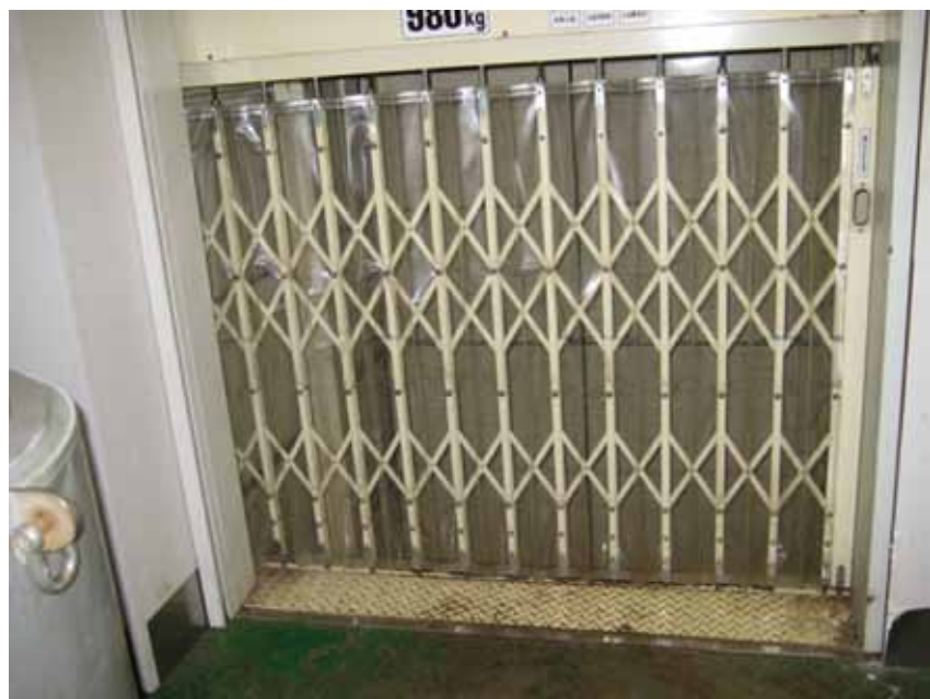
2階ホールディングゲート追加前