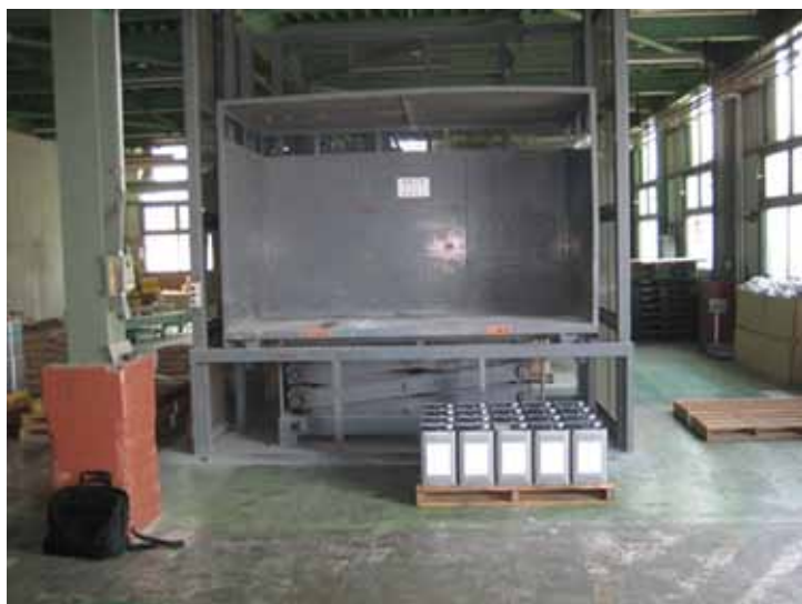
1階ホールディングゲート追加前