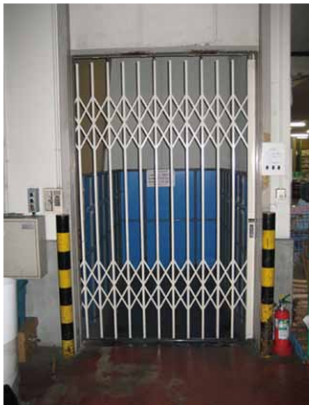
1階観音扉取付け前