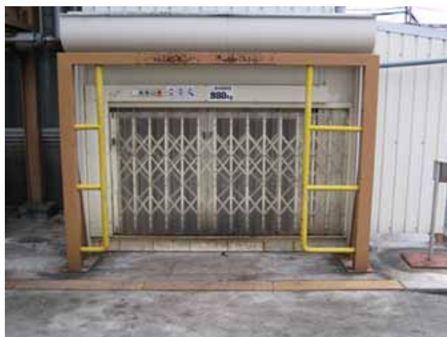
1階ホールディングゲート追加前