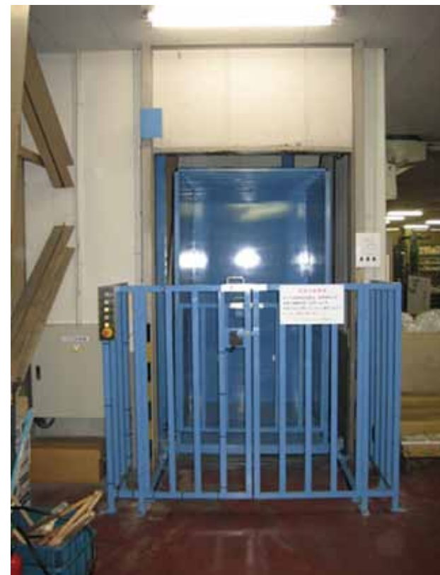
1階観音扉取付け後