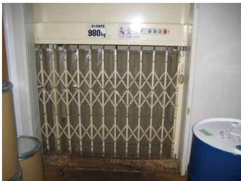
3階ホールディングゲート追加前