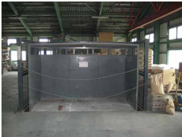
2階ホールディングゲート追加前