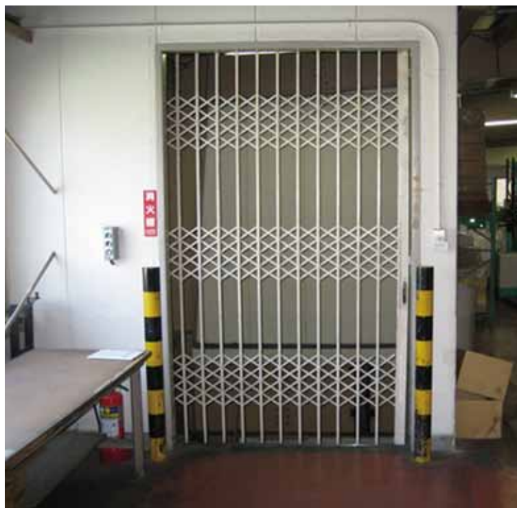
2階観音扉取付け前